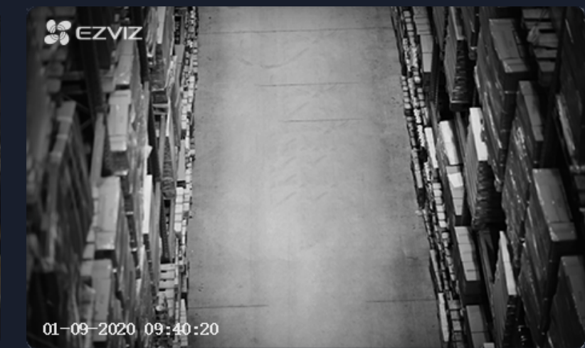
Modo de visión en blanco y negro