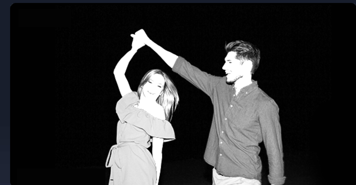
Visión nocturna normal