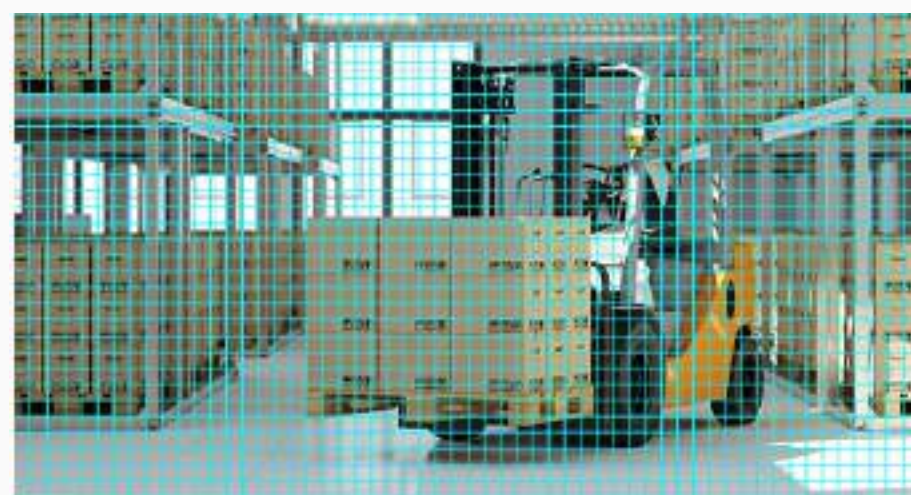
H.264 (compresión de vídeo convencional)

La cámara incluye la avanzada tecnología de compresión de vídeo en formato H.265, con la que se consigue una mejor calidad de vídeo con solo la mitad del ancho de banda y del espacio de almacenamiento del formato de compresión de vídeo anterior (H.264).