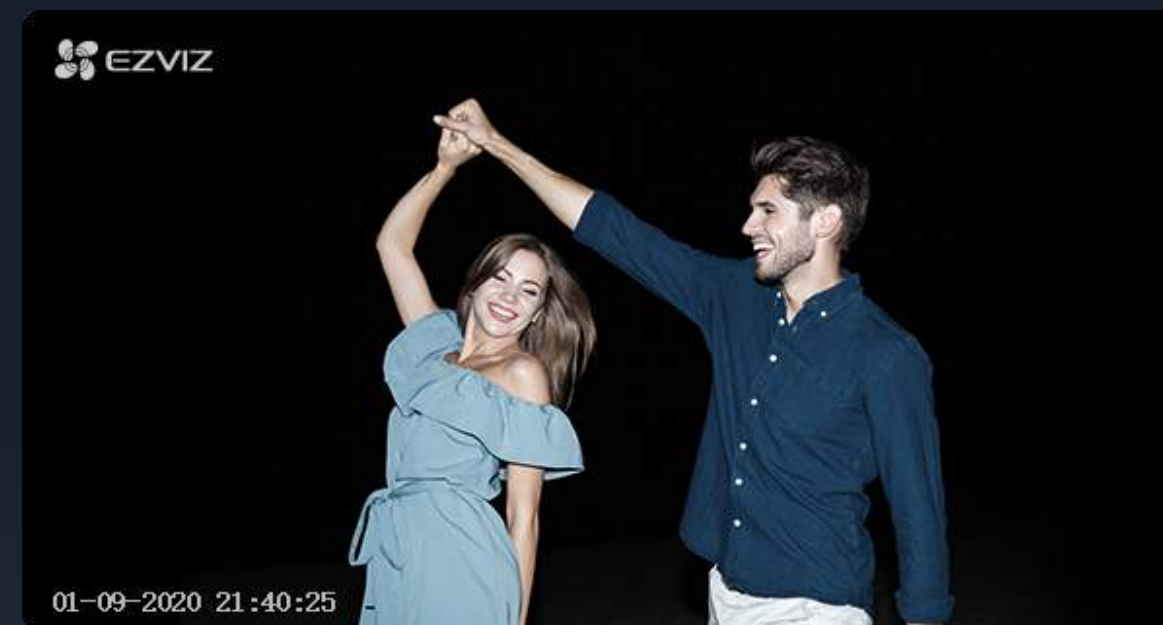
Visión nocturna con la cámara C3N

La cámara C3N funciona con tecnología de calidad de imagen (PQ) avanzada que se basa en la detección inteligente del entorno en un momento dado. Cuando alguien se aproxima, ajusta automáticamente el brillo de la imagen para evitar una sobreexposición. Verá muchos más detalles que en un vídeo proveniente de sistemas convencionales.