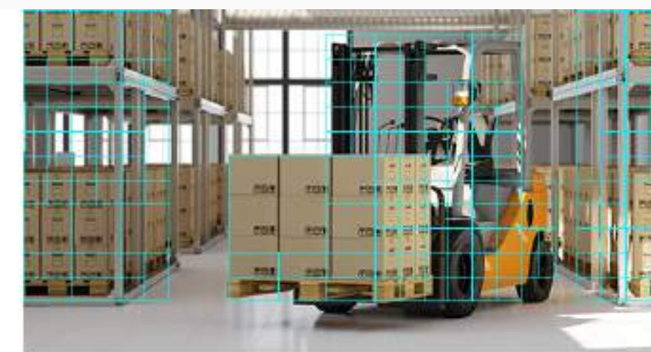
H.265 (compresión de vídeo mejorada)